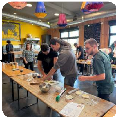
Journée accords Mets et Bières