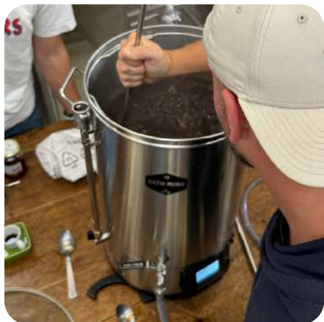
Journée de brassage